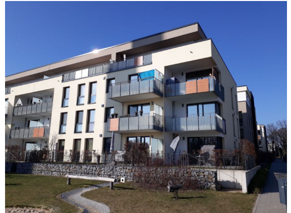
Rückseite des Gebäudes