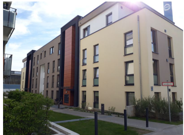
Objektansicht (Hauseingang siehe hinten)