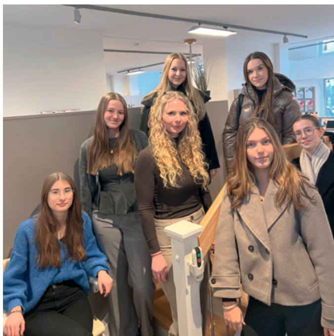
Unsere Auszubildenden und eine Praktikantin zu Besuch in der Wohnberatung